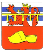
Commune de Nassogne